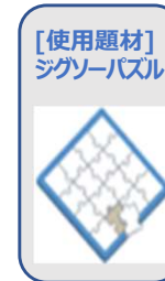
[使用題材] ジグソーパズル

問題解決型のQCストーリーとよく使われる新QC 7つ道具の講話、ならびにグループに分かれての体験学習を通して問題解決型の手順を習得します。