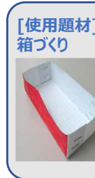
[使用題材] 箱づくり

課題達成型のQCストーリーとよく使われる新QC 7つ道具の講話、ならびにグループに分かれての体験学習を通して課題達成型の手順を習得します。